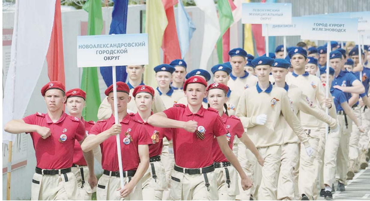
В Ставрополе в Центре военно-спортивной подготовки и патриотического воспитания имени Героя России Никиты Гусева завершились Юнармейские игры. Состязания объединили 33 команды из всех территорий края.

УЧАСТНИКИ продемонстрировали навыки разборки и сборки автомата, преодоление полосы препятствий, приняли участие в военной викторине, военизированной эстафете, успешно прошли строевой смотр. Помимо профильных состязаний для юнармейцев разработали и обширную образовательную программу: специалисты центра провели мастер-классы по управлению беспилотниками и тактической подготовке.