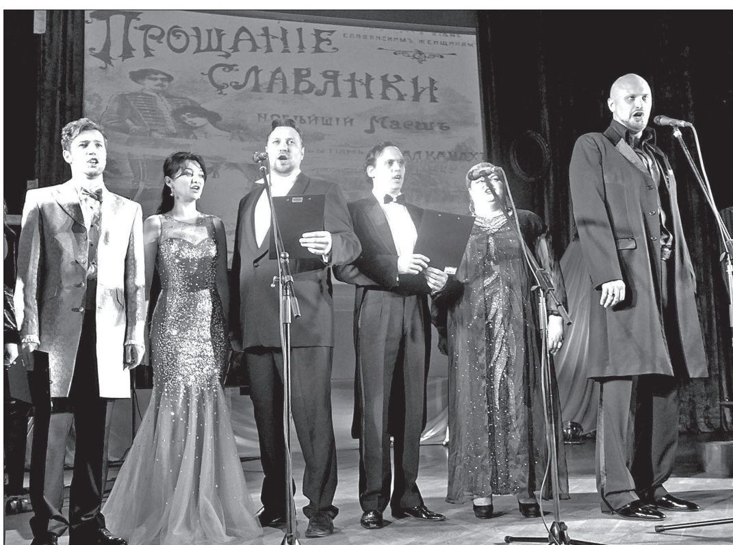
Участники фестиваля хором исполняют «Прощание славянки».