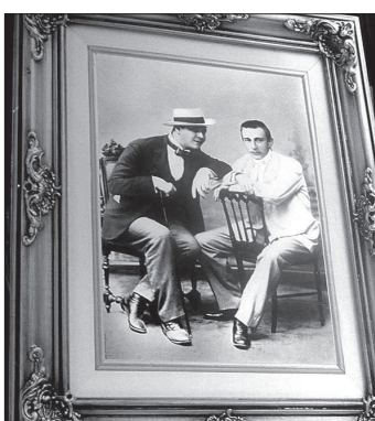
Блиские друзья: Федор Шалаяпин и Сергей Рахманинов.

последний концерт в Кисловодске. Курзал (ныне зал филармонии имени Сафонова) был переполнен. Не только сидели, но и стоячих мест не было.